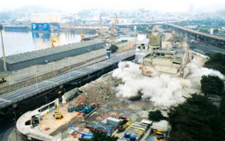
Implosão do moinho que dará lugar ao Port Corporate Tower