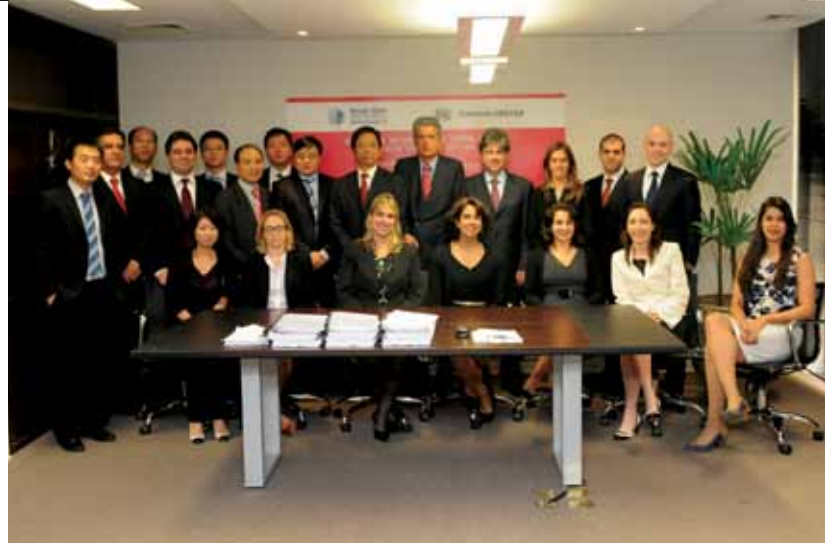
Equipe da State Grid e da Tishman Speyer após assinatura do contrato de venda