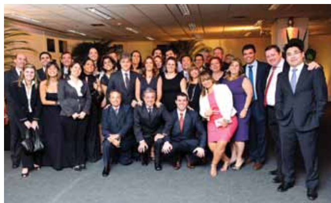
Time da Tishman Speyer prestigia o evento de entrega do Galeria